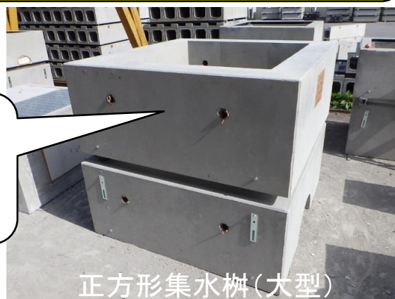
正方形集水枳(大型)